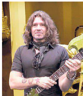
Il chitarrista e cantante Phil X

Hendrix Day al Kaleidos Sul palco salirà Phil X